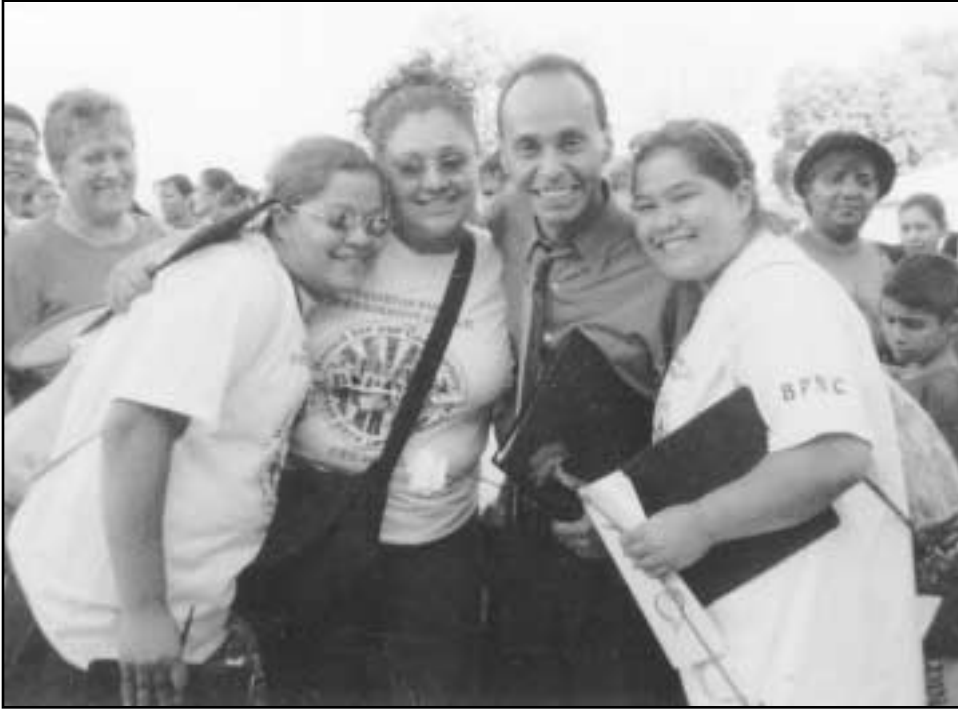
Members of the Brighton Park Youth Council (BPYC) pose for a photo with Congressman Luis Gutiérrez at the Neighborhood Safety March on June 18th, 2001.

Brighton Park fights for issues here at home