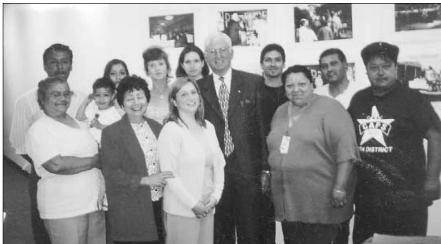
Brighton Park residents and leaders met with Alderman Burke to discuss issues affecting their community.

I personally feel satisfied with our goals since there is no better satisfaction to a volunteer than work that is done from the heart. There have been positive changes in a community with many needs. A community that was once destined to become a free arena for gang activity, drugs and delinquency, to be manipulated by the few at the cost of the many, has now become a strong and unified neighborhood of leaders. Just as in the beginning four years ago, we hope and work hard so that our success continues to bring positive changes to the BPNC community.