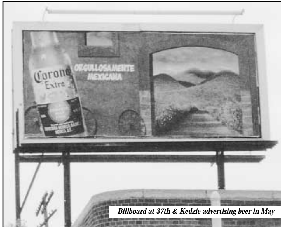
Billboard at 37th & Kedzie advertising beer in May

Money and billboard space that used to promote liquor is now being used by youth to encourage other kids to say no to drugs and get involved in their community. The Brighton Park Youth Council's (BPLYC) billboard, which reads "Don't follow the crowd, join the Brighton Park Youth Council," replaces a Corona Beer ad and will be at its site on Kedzie and 37th St. through August 23rd.