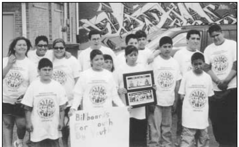
Brighton Park Youth Council celebrates their new "By Youth, For Youth" Billboards.