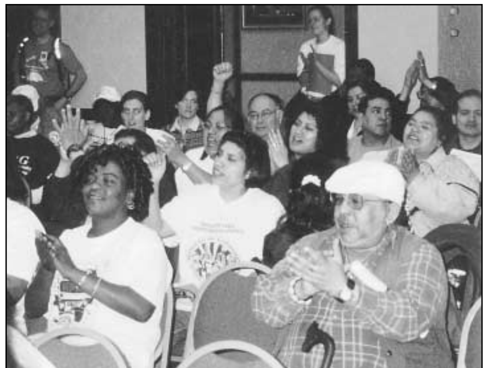
Brighton Park Neighborhood Council members cheer during a speech at this years National People's Action Conference in Washington D.C.