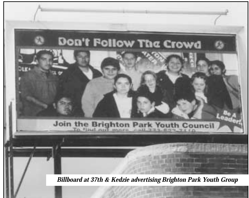
Billboard at 37th & Kedzie advertising Brighton Park Youth Group

Dinero y espacio que anteriormente se utilizaba para anunciar el alcohol actualmente se está utilizando para motivar a los jóvenes a rechazar las drogas y de esa forma involucrarse más con la comunidad. La pancarta que dice "No sigas a los demás, participa en el Concilio Juvenil de Brighton Park," reemplaza un anuncio para Cerveza Corona, y permanecerá en la Kedzie y la calle 37 hasta el 23 de agosto.