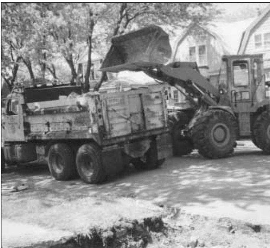
One of the many recent victories of BPNC, 36th St. residents enjoy new sidewalks built this summer by these workers