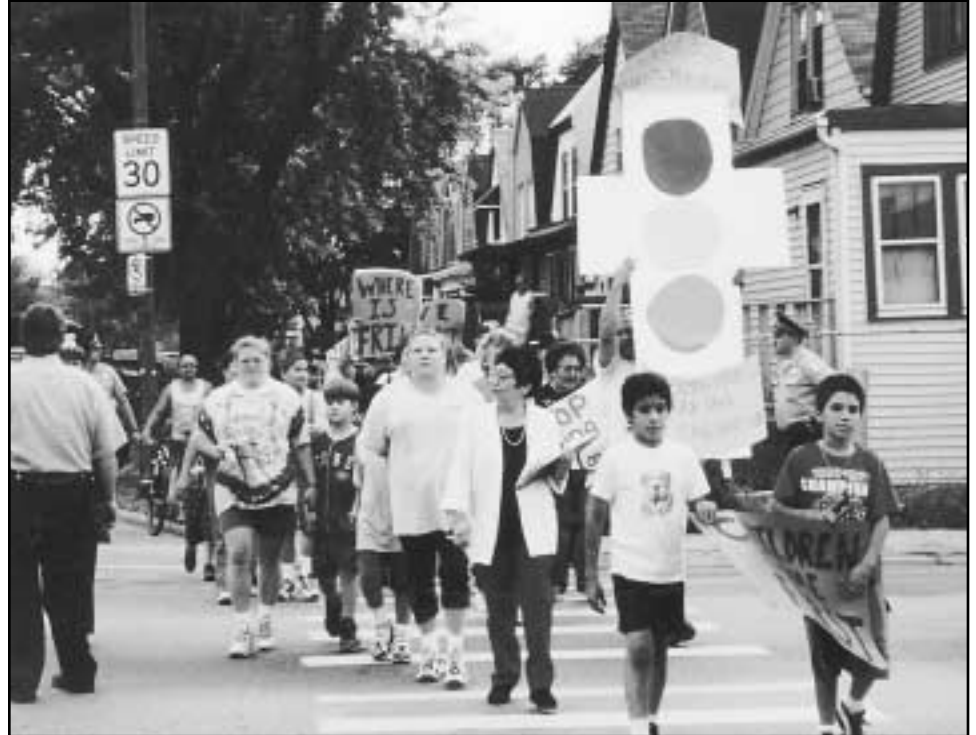
BPNC Leaders march for a traffic light at 36th St. & California on July 26, 2000.